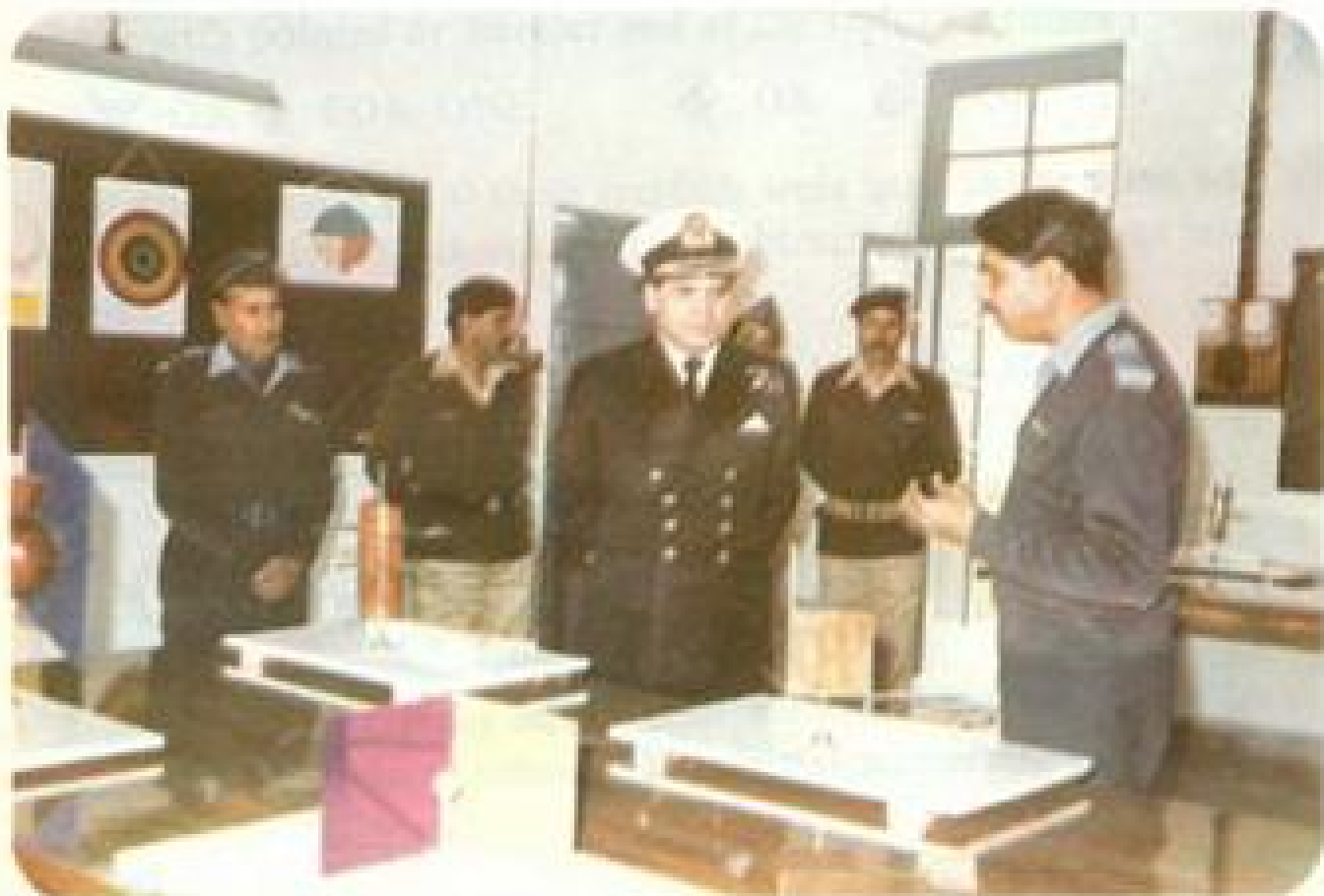
President ISSB visiting