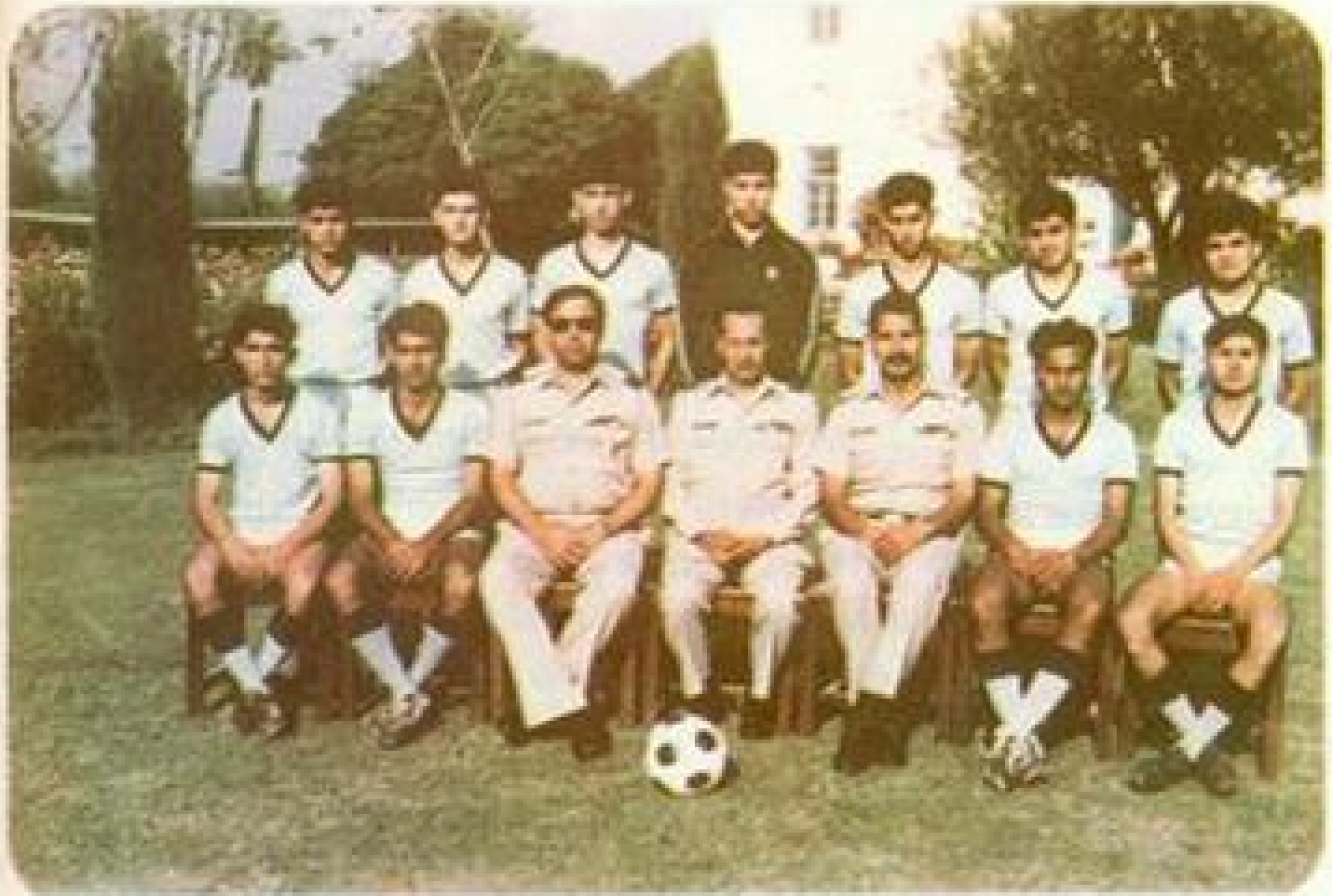
College Football Team