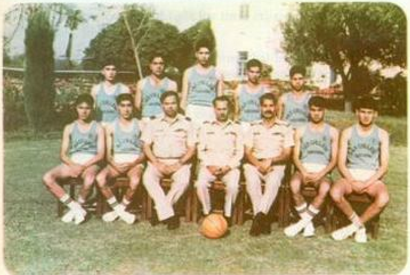
College Basketball Team