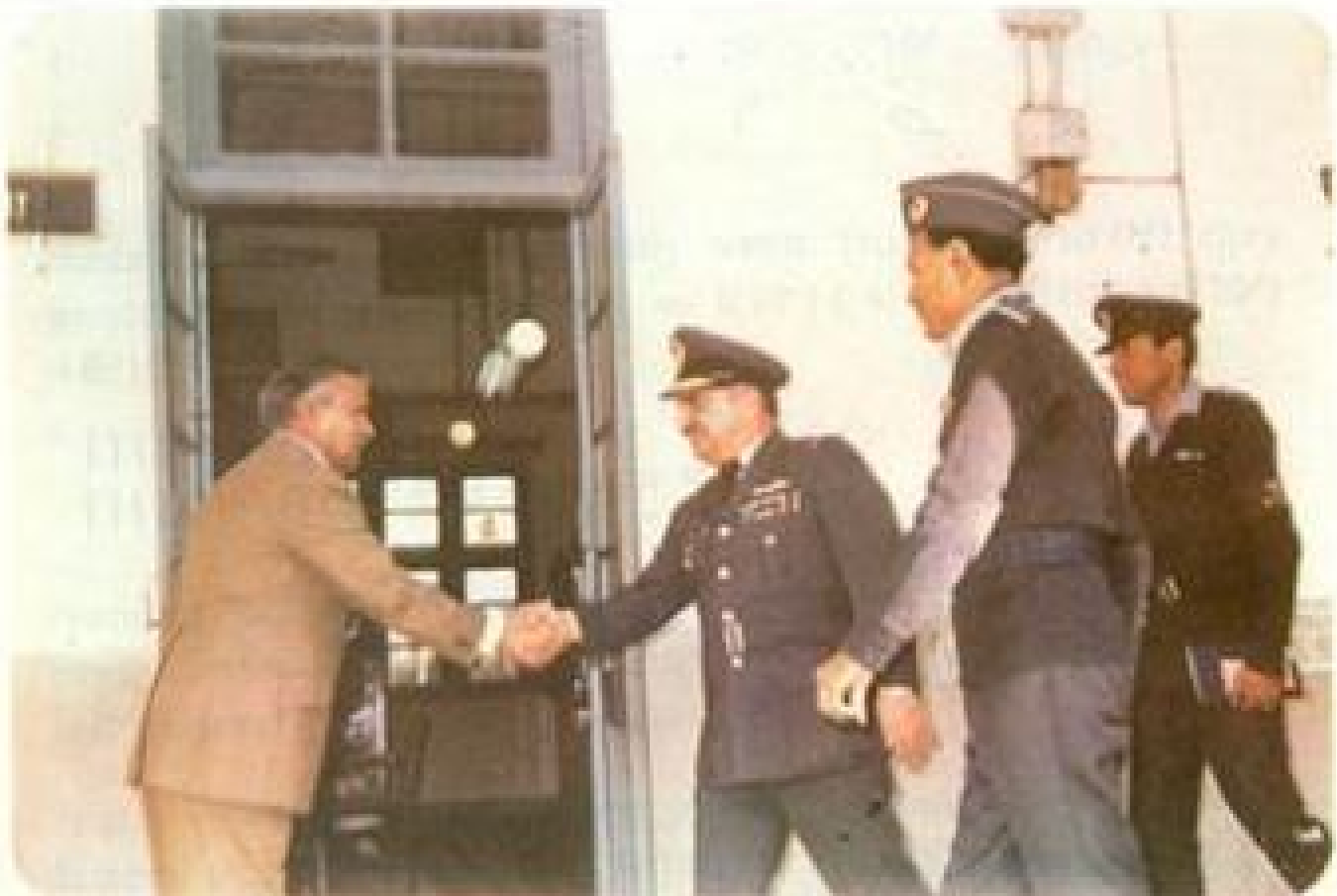
Air Marshal Syed Shabbir Hussain VCAS in the College Library during the visit