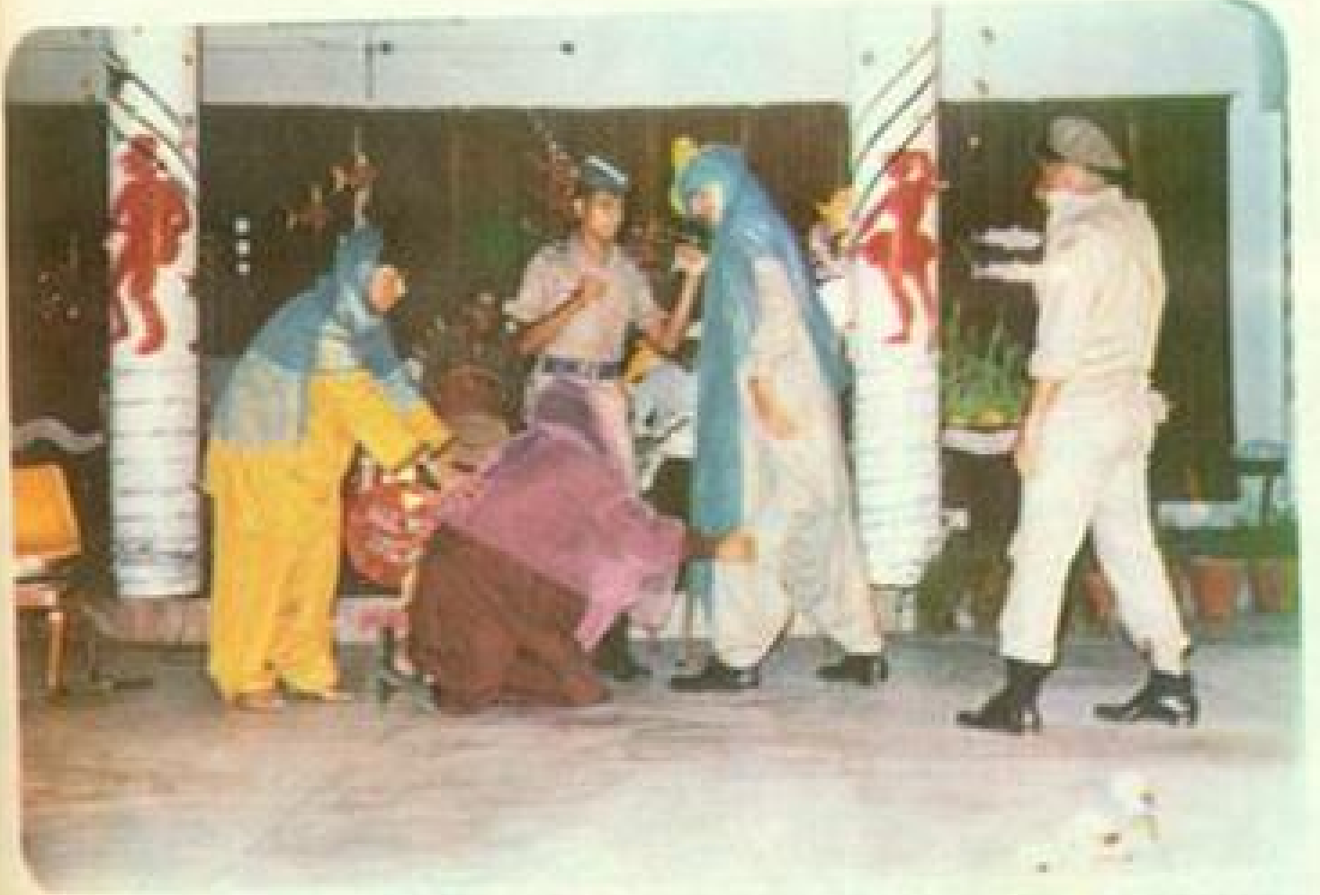
A skit in variety Programme