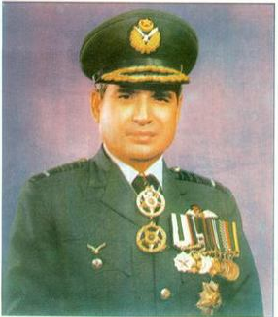
AIR CHIEF MARSHAL JAMAL AHMAD KHAN N.I (M), SJ, SBT CHIEF OF THE AIR STAFF PAKISTAN AIR FORCE