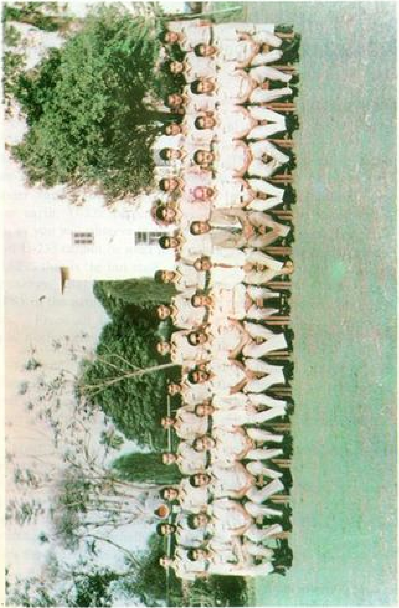
লেখকগণের গ্রুপ ফটো WRITERS OF SHAHBAZ