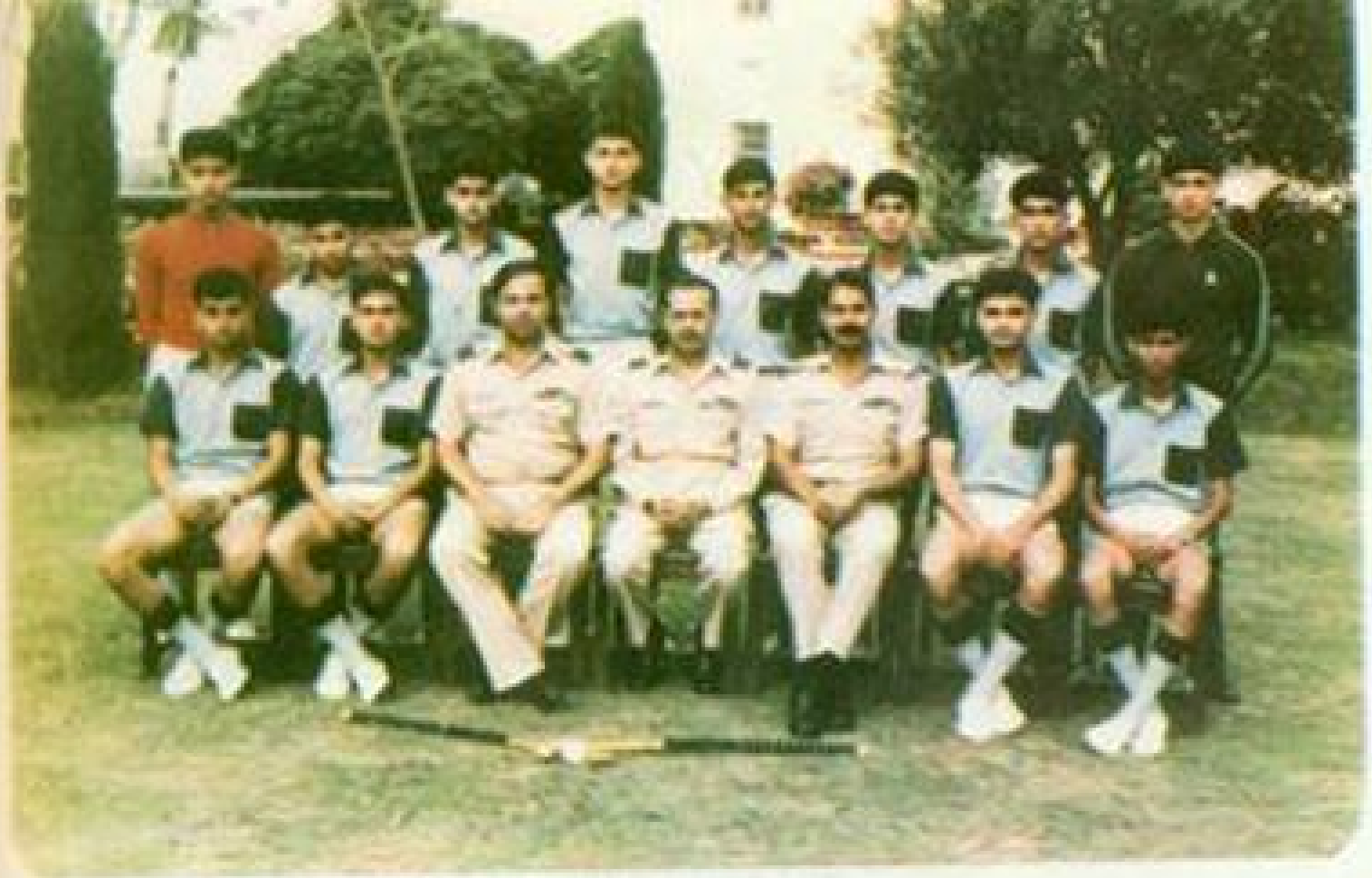
College Hockey Team