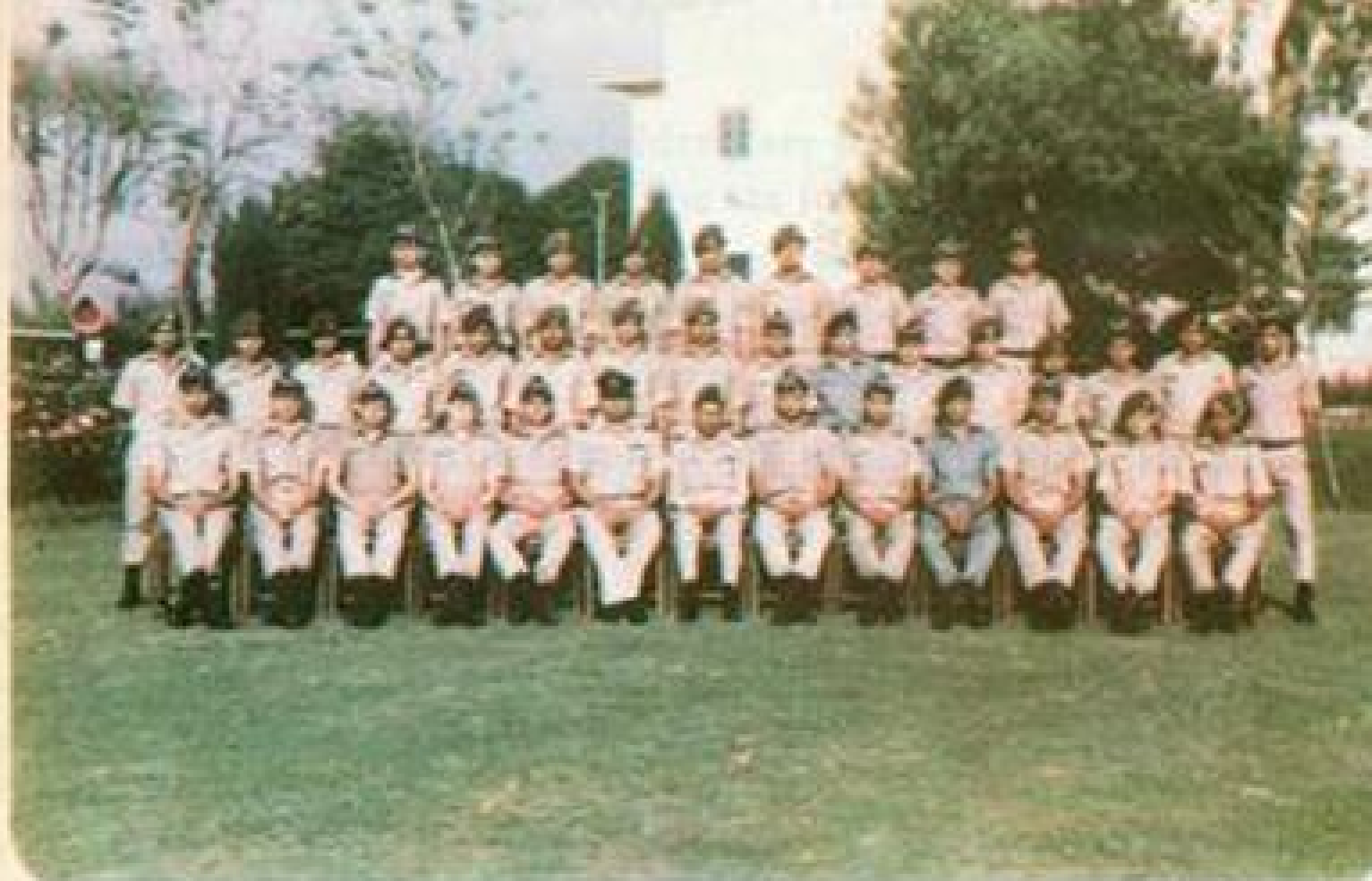
Passing-out Cadets of 85th G.D. (P)