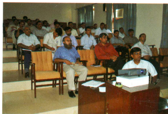
The Principal and faculty attending Professional Development Workshop