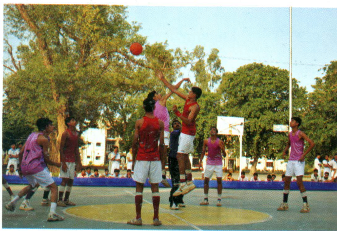
The higher the better - opponents struggling to grab the ball

The Principal gave away certificates to the finalist teams and trophy to jubilant Furians.