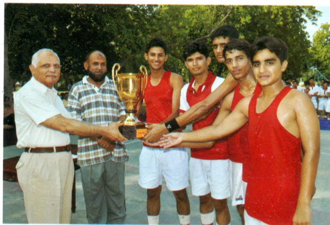
Jubilant Furians receiving trophy from the Principal