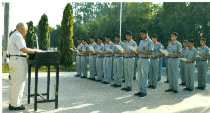
The new Appointment Holders taking oath