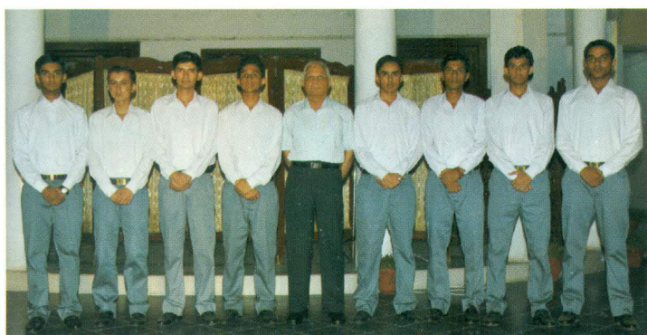
The new House Captains snapped with the Principal